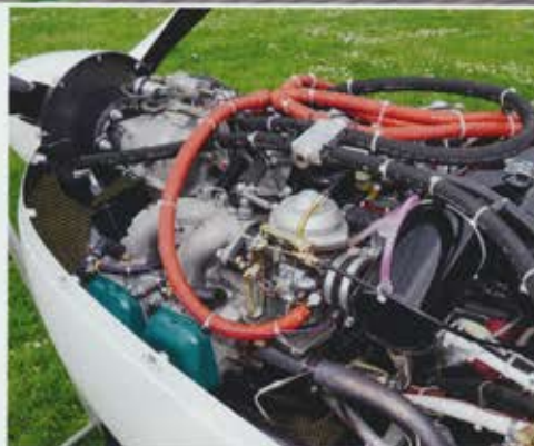
Sorgfältig installiert: 100-PS-Vergasermotor Rotax 912S mit Airbox von BRM

* mit Einziehfahrwerk, 100-PS-Motor, BRM-Airbox, Festpropeller, Funk, Heizung, inkl. MwSt. Aufpreis für Neuform-Verstellpropeller: 5000 Euro