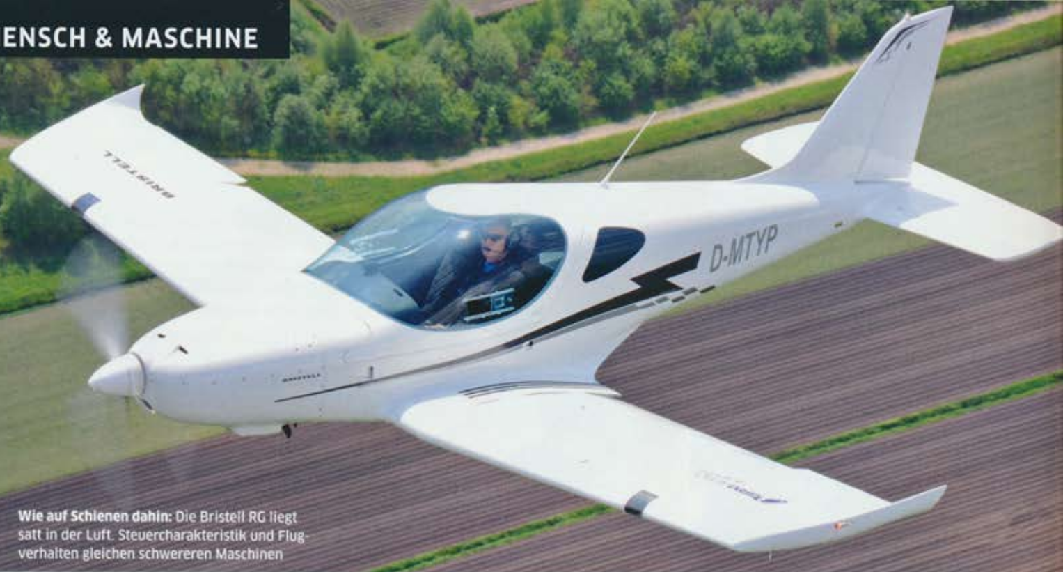
Wie auf Schienen dahin: Die Bristell RG liegt satt in der Luft. Steuercharakteristik und Flugverhalten gleichen schwereren Maschinen