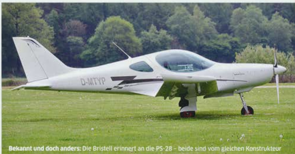
Bekannt und doch anders: Die Bristell erinnert an die PS-28 – beide sind vom gleichen Konstrukteur