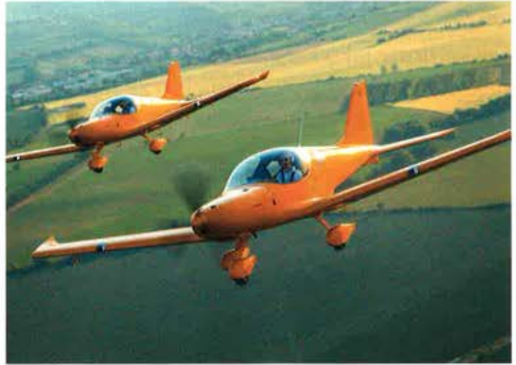
Letoun Bristell Classic s pevným podvozkem.